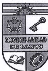
NESTOR OSVALDO GRINDETTI Intendente Municipal