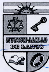
NESTOR OSVALDO GRINDETTI Intendente Municipal